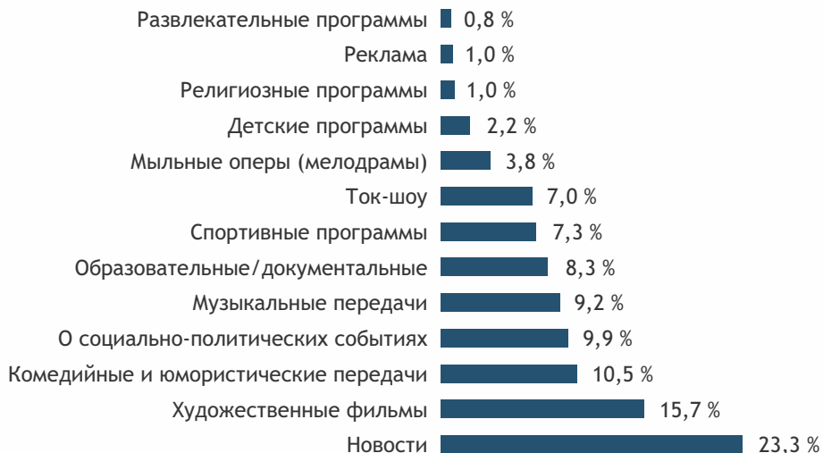
Рисунок 3. «Какие передачи Вы чаще всего смотрите по телевизору?» 35

Доминирование российского телевидения в Казахстане уже проявило себя с негативной стороны в свете украинно-российского конфликта, в результате которого общественное мнение по вопросу Крыма разделилось.