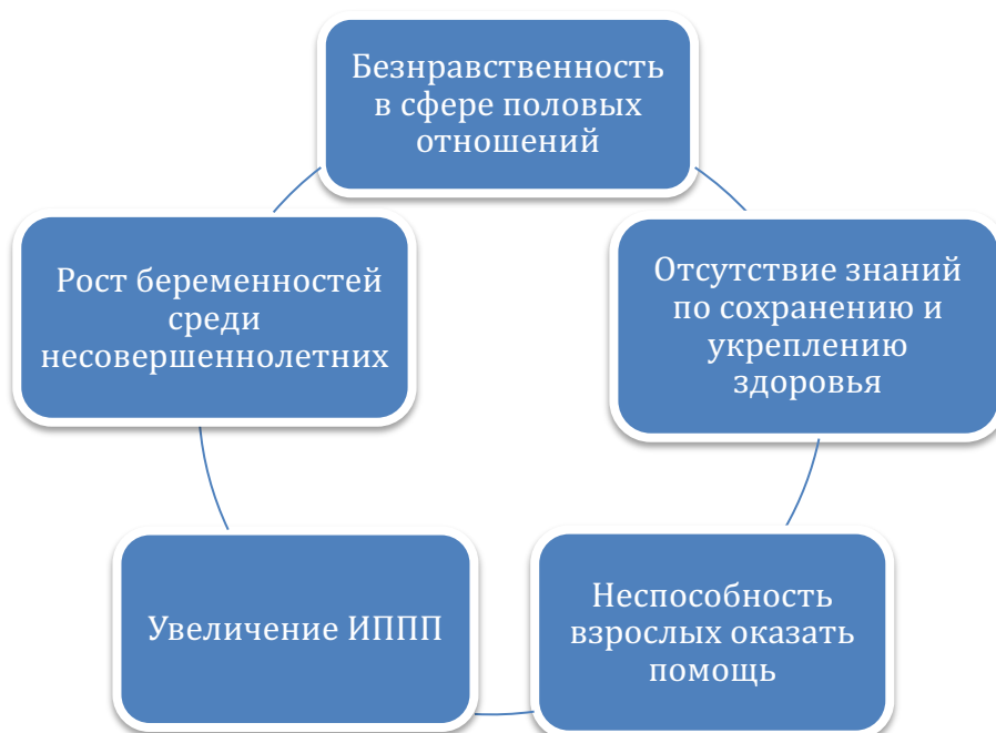
Рисунок 1. Проблемы в сфере половых отношений, согласно Концепции по нравственно-половому воспитанию в Республике Казахстан.

В 2001 году была разработана «Концепция по нравственно-половому воспитанию в Республике Казахстан», регламентирующая проведение эффективной политики в сфере репродуктивного и сексуального здоровья детей, подростков и молодежи в целом. В программном документе отмечалось, что одной из приоритетных задач общества является создание здоровых и безопасных условий для жизни и учебы детей, подростков и молодежи, обеспечение развития интеллектуальных, духовных и физических сил, формирование прочных основ нравственности и здорового образа жизни. 11 Данная концепция строилась на основе анализа ситуации на тот момент в сфере половых отношений и выводила ряд главных характеристик (рисунок 1):