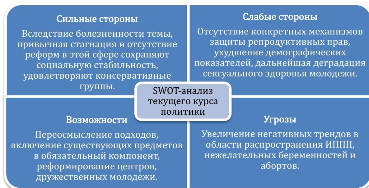
Рисунок 3. Текущий подход политики к репродуктивным правам молодежи.

Игнорирование темы, дальнейшая консервация проблем, отсутствие открытой дискуссии на высшем уровне способны только ухудшить и без того крайне сложную ситуацию. Отсутствие курса полового просвещения, закрепленного в качестве обязательного компонента учебной программы, отчасти является причиной того, что подростки не имеют достаточных знаний и социальных навыков. 43 Однако при существующих условиях, прошлом опыте и имеющихся законодательных нормах у Казахстана есть все шансы на успешное введение учебного курса, охватывающего половое просвещение (рисунок 3).