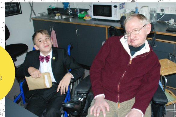
Исаак Мустопуло және Стивен Хокинг