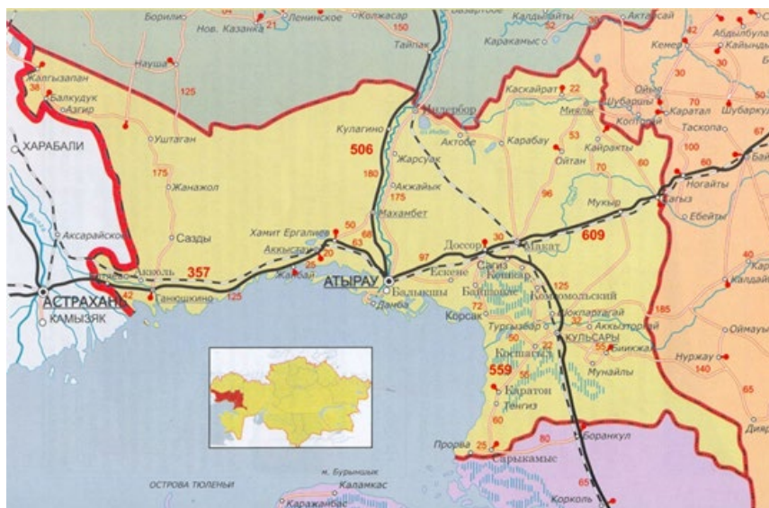
Атырау облысының картасы

Қорыта келгенде, жоғарыда берілген облыстың географиялық орналасуының сипаттамасы мен өңірдің білікті биолог, энтомолог мамандарының пікірлерін негізге алсақ, Атырау облысында маса мәселесі болған, бар және бола береді, оған себеп облыстың орналасу ерекшелігі. Біз масаны мүлдем құртып жібере алмаймыз, біздің мақсатымыз масалардың санын азайту және олармен күресудегі тиімді, ұтымды жолдарды анықтау және сол жолдарды жүзеге асыру үшін тәжірибеге енгізу.