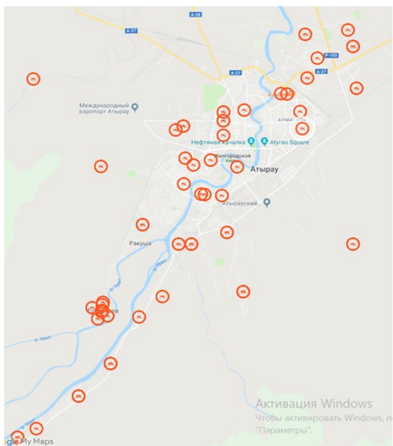
Тұрғындар шағымының негізінде жасалған карта